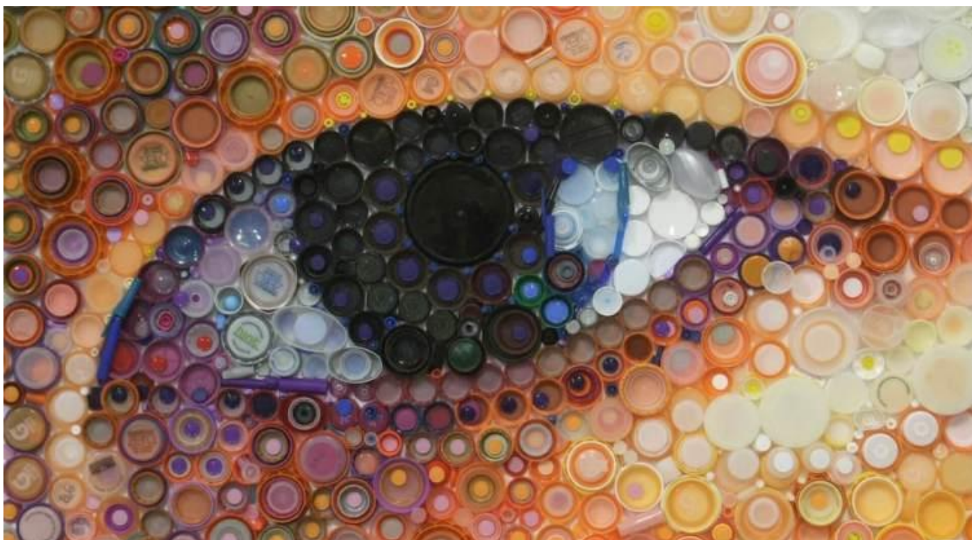
Arte con tapitas de plástico