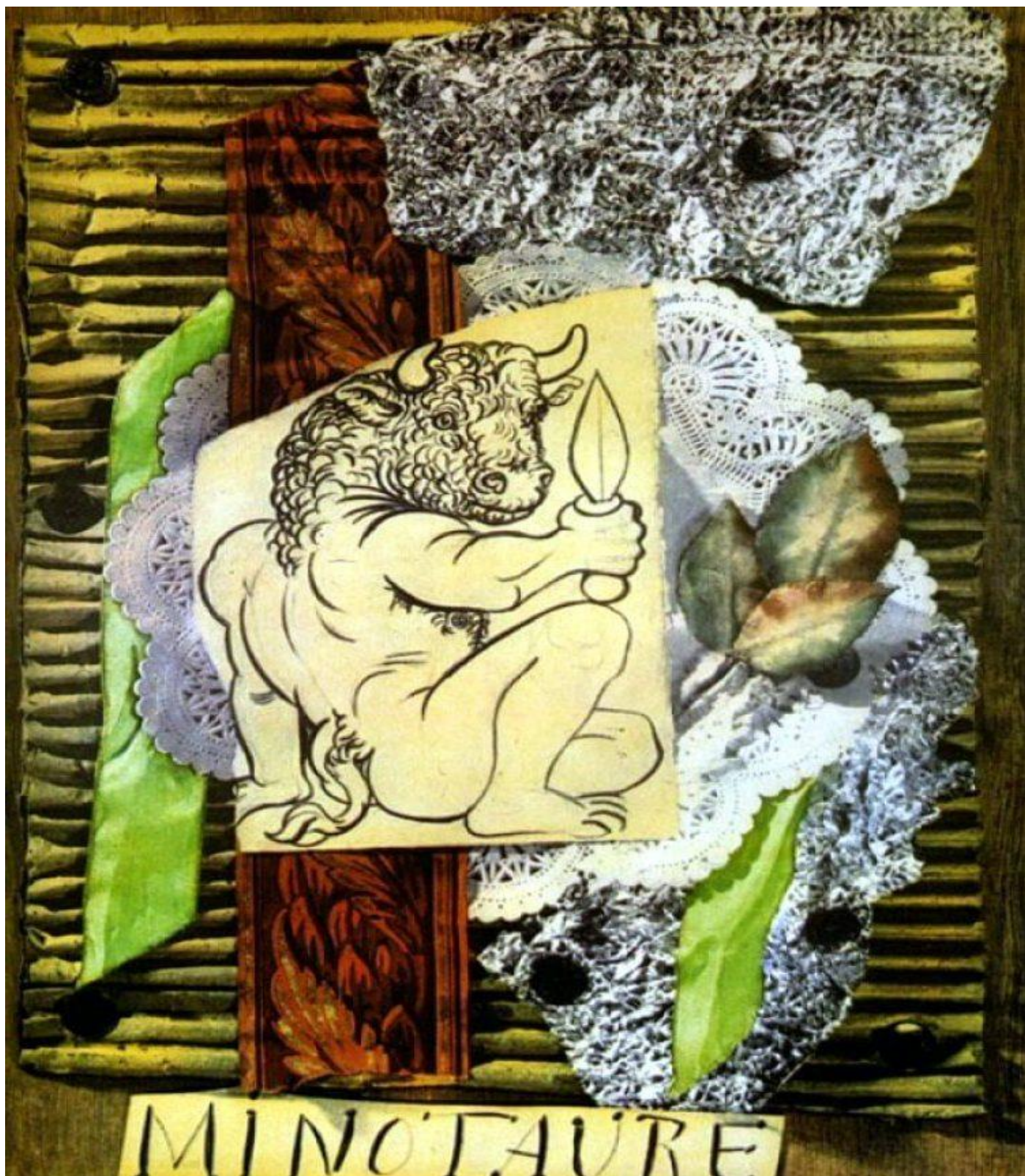
Portada primer número de la revista Minotaure

En 1933 Pablo Picasso creó uno de estos collages tridimensionales como portada para el primer número de la revista Minotaure, compuesto por una tabla de madera en la que introdujo chinchetas, cartón ondulado, papel de plata, cinta, papel de pared, tapete de papel, hojas de lino quemadas y carboncillo.