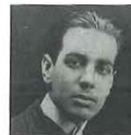
JORGE LUIS BORGES (1899-1986)

Nació en Buenos Aires y murió en Ginebra, Suiza. Escritor de una cultura vastísima, sus numerosas obras, que incluyen ensayo, poesía y cuento, lograron un reconocimiento universal y han ejercido una notable influencia en la producción de grandes escritores. Entre sus obras en verso se destacan Fervor de Buenos Aires (1923) y Luna de enfrente (1925); en prosa, los cuentos de Ficciones (1944), El Aleph (1949) y El informe de Brodie (1970), y los ensayos de Discusión (1932) y Otras inquisiciones (1952).