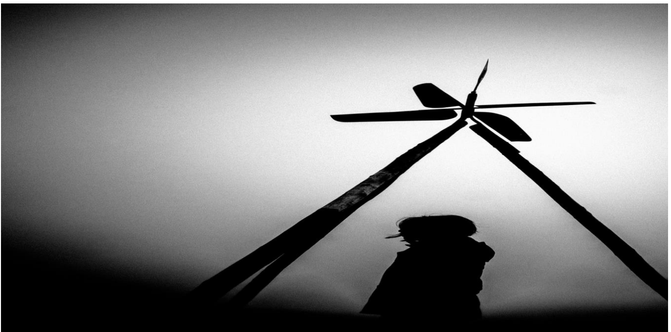
Blanco y negro