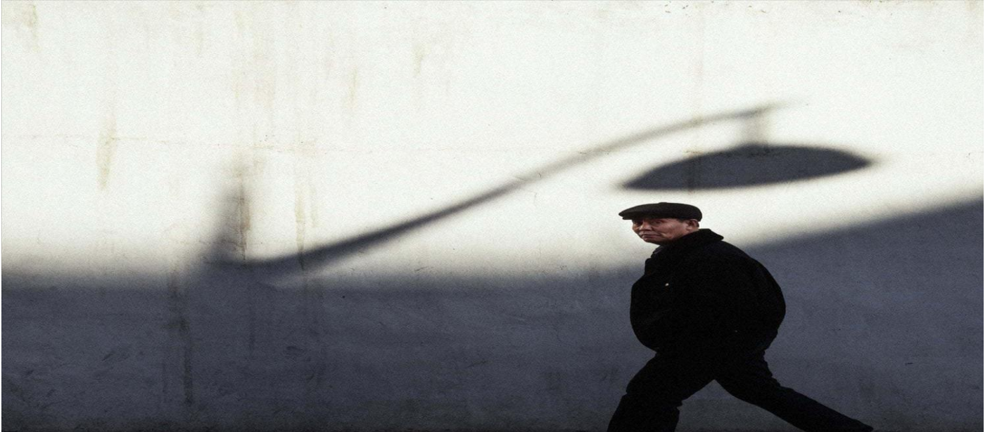
Trabaja la composición

La perspectiva, aprender a romper las reglas de composición cuando proceda, conocer y trabajar las líneas, los puntos de fuga, y, en general, cuanto más conozcas y domines la composición de las imágenes más herramientas creativas tendrás en tu poder.