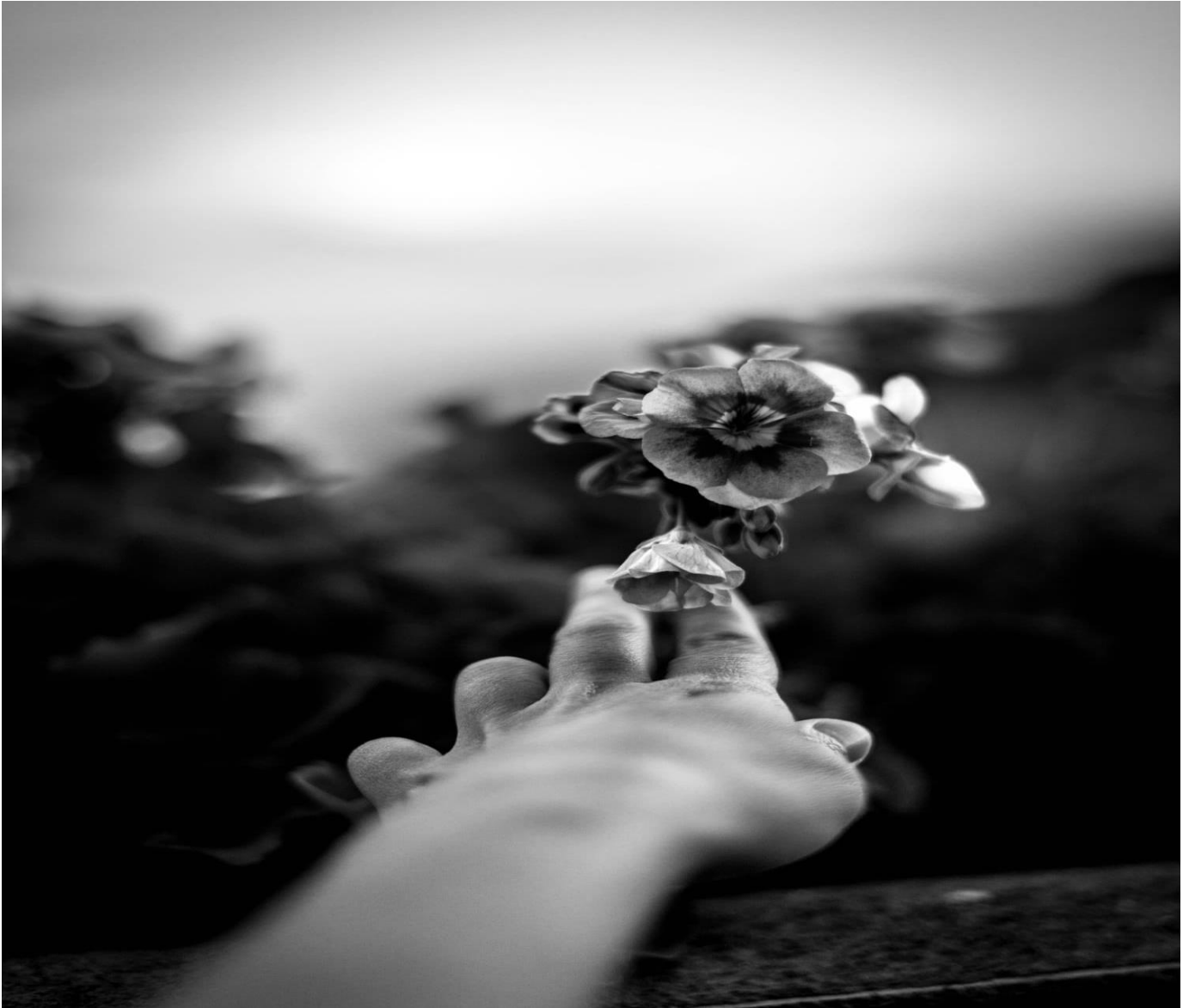
La cámara al servicio de la creatividad del fotógrafo (o fotógrafa) @alexadeblois

La cámara debe estar al servicio del fotógrafo, al tuyo, como un pincel está al servicio de un pintor. Es decir, sólo es una herramienta para lograr tu objetivo.