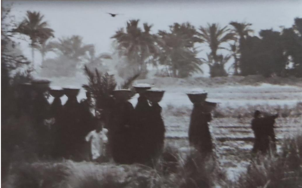
Procesión para llevar alimentos a los muertos en Egipto.

Reflexiona y responde: (También copia y responde en tu carpeta).